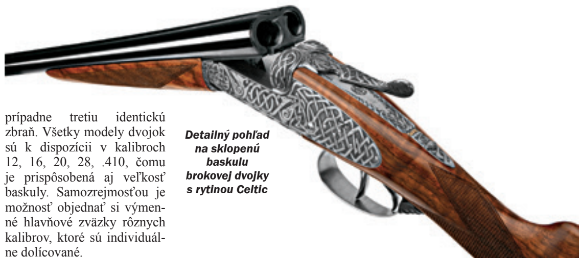
Detailný pohľad na sklopenú baskulu brokovej dvojky s rytinou Celtic

Brokové dvojky sa delia na niekoľko modelových radov podľa povrchovej úpravy, typu a náročnosti aplikovaných ryteckých prác a v neposlednom rade podľa triedy a štruktúry použitého orechového dreva. Všetky modely sú osadené v duchu tradícií dvoma nezávislými bočnými mechanizmami H & H, ktoré sa ovládajú dvojspúšťou. Túto klasickú koncepciu podčiarkuje rovná anglická pažba. Na želanie zákazníka sa dá systém zbrane opatriť jednospúšťou a zapažbiť do modernejšej pažby s pištoľovou rukoväťou alebo typom Prince of Wales. Náruživým poľovníkom, ktorí pri love používajú ďalšie osoby na nabíjanie, firma ponúka možnosť vyrobiť aj druhú,